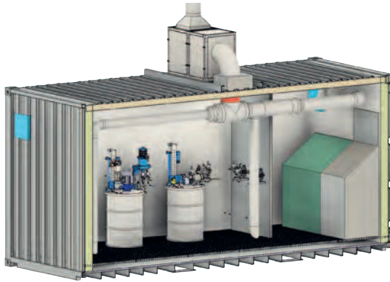
Gefahrenstoffcontainer mit Mischanlage, flexibler 3K Lackieranlage, Arbeits- und Reinigungstisch – Individuell auf Kundenwunsch