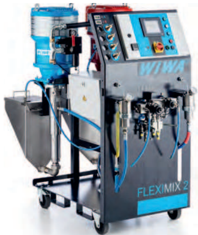
Wagner GM 5000 EAC – E-Statik Beschichtungspistole