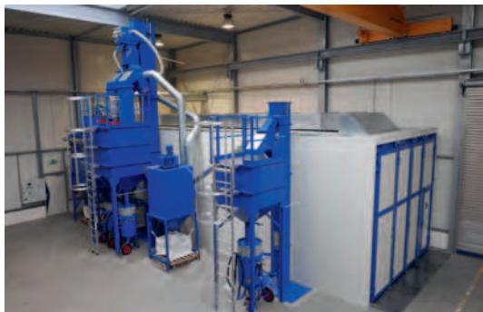
Strahlhalle ausgelegt für zwei verschiedene Strahlmittel mit automatischer Magnetabscheidung und Aufbereitungsanlage