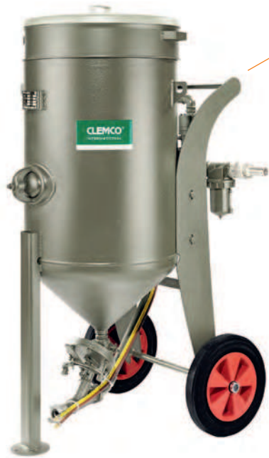
Strahlkessel von 20 l bis 200 l Inhalt mit unterschiedlichen Dosier- und Automatikventilen