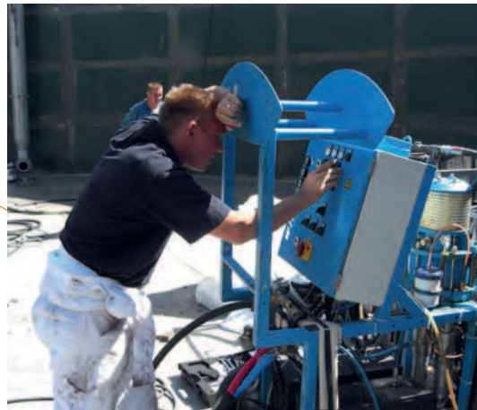
Inbetriebnahme einer Wiwa PU-Anlage vor Ort im zu beschichtendem Objekt