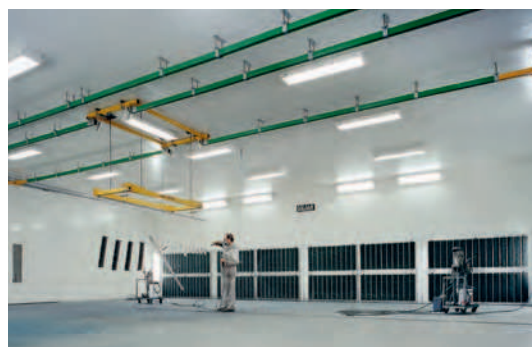
Beschichtungshalle mit Förderbahn, Absauganlage, Wärmerückgewinnungssystem und Heizung