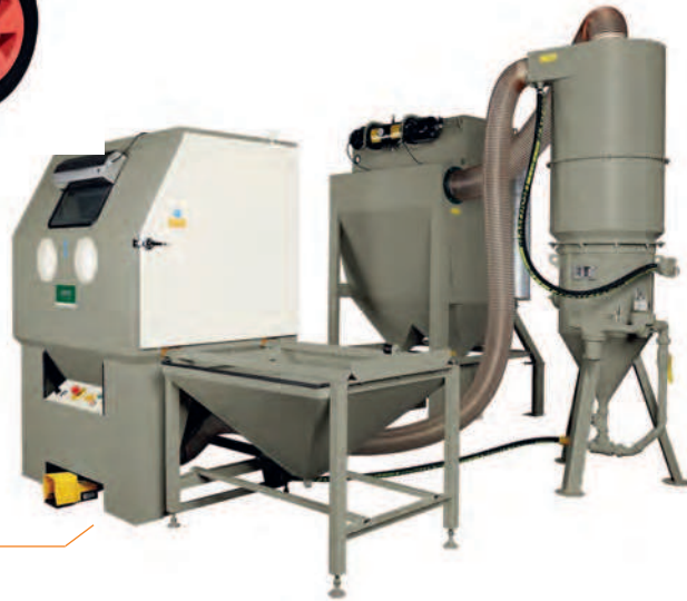
Saug- oder Druckstrahlkabinen mit vielen Optionen wie Einfahrwagen, Drehteller, Gummi auskleidung u.v.m.