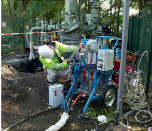
Reparatur einer Kundenanlage vor Ort auf der Baustelle